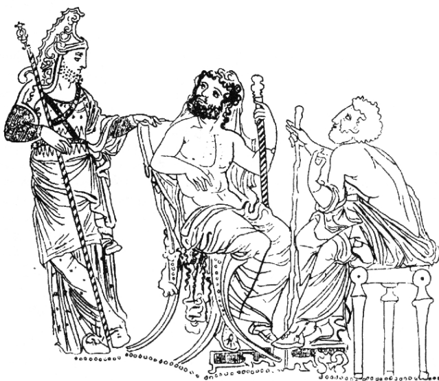
Rhadamanthys en zijn collega's.

Tekening van Roscher, 1884, naar een moderne aardewerkschildering.