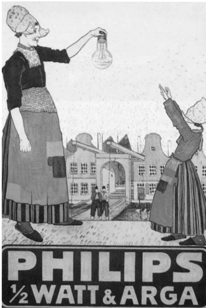
bron: A.F. Manning (red.), Nederland rond 1900 , Amsterdam 1993, pag. 156