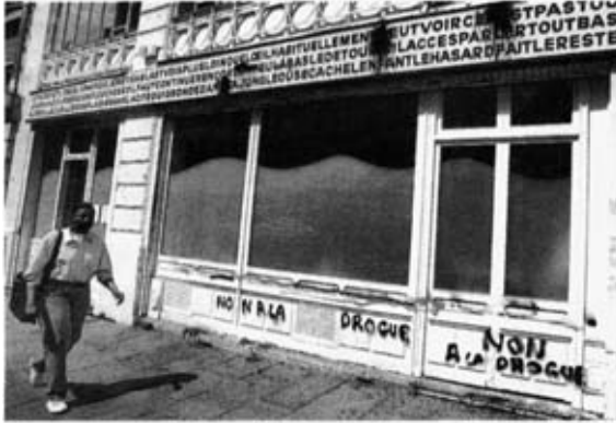
Rejeté par certains habitants du X e arrondissement, le centre d'accueil de la rue Beaurepaire devrait déménager d'ici au 31 mars 1999.

Personne ne veut d'un centre d'échange de seringues 12) près de chez lui. Pourtant, que de morts évitées!