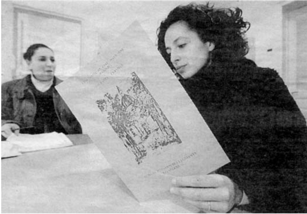
Bureau Erasmus-Socrates à la Sorbonne. Envie de partir étudier à l'étranger ? N'hésitez pas, des programmes d'échange existent et de nombreuses places restent vacantes !