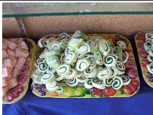
Eski ve yeni Hacı Bekir

http://www.biglook.com/bigistanbul/eskiist/lokum.asp