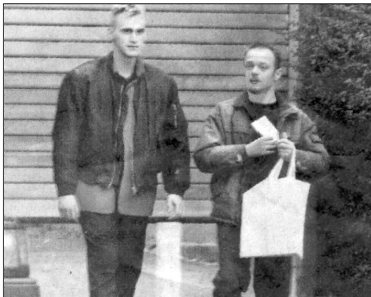
Die dümmsten Bankräuber Deutschlands waren nach dem Urteil wieder auf freiem Fuß.