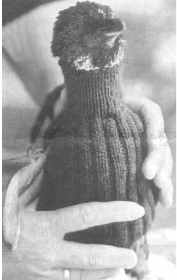
Er ist von Kopf bis Fuß auf Wolle eingestellt! Dieser Zwerg-Pinguin ist modisch voll im Trend: Im Selbstgestrickten hat es der Kleine auch im Winter mollig warm.

So viel, so gut. Mit der überwältigenden Hilfsbereitschaft hatte niemand gerechnet: Jetzt türmen sich 10.000 Strickpullis in den Räumen der kleinen Umweltorganisation. Und der Postbote bringt täglich mehr. Viele Modelle werden an andere Pinguin-Stationen weitergereicht: für den Notfall.