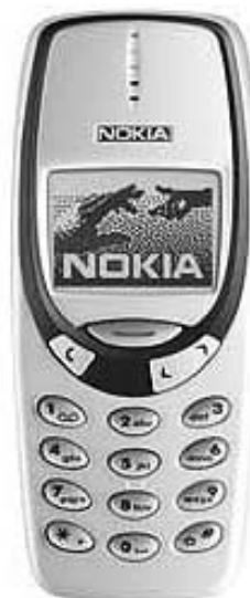
Handys geben ungesunde Strahlungen ab. Ein neues Material soll die Strahlung vermindern.

Das schützende Material kann zwischen zwei Plastikschichten gelegt werden, die die Hülle des Handys bilden. Die meisten Strahlen (90 Prozent) werden dann von der Schicht geschluckt. Sie gehen nicht nach außen. Der Kopf bekommt so kaum mehr schädliche Strahlen ab.