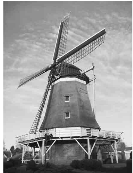
2 windmolen in Zwolle