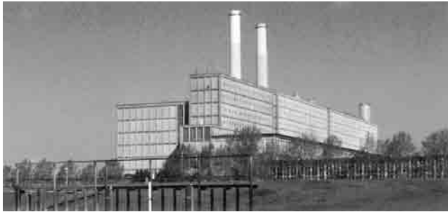
1 elektriciteitscentrale in Harculo