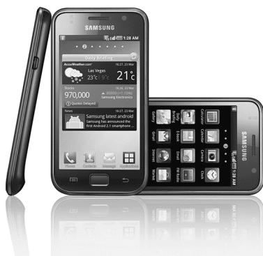
Een Samsung Galaxy smartphone.

In het tweede kwartaal van 2011 werden in Europese landen 21,8 miljoen smartphones verkocht, tegenover 20,4 miljoen gewone gsm's. Dat meldt de technologiewebsite Engadget.