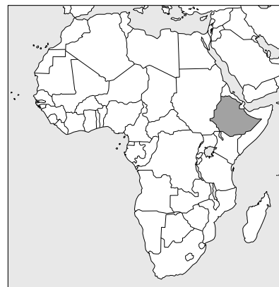
Legenda: ■ Ethiopië

Er is te weinig goed opgeleid personeel in de gezondheidszorg en vooral op het platteland is er een gebrek aan medische voorzieningen. Bovendien zijn delen van oost- en zuidelijk Afrika zo afgelegen, dat er simpelweg geen arts of verpleegkundige kan komen. Daarom zet AMREF Flying Doctors in Afrika al zijn kennis en ervaring in. Juist ook om mensen voor te lichten over gezond blijven, want voorkomen is nog altijd beter dan genezen. Daarnaast leiden we mensen op en zorgen voor zaken als medicijnen en veilig drinkwater.