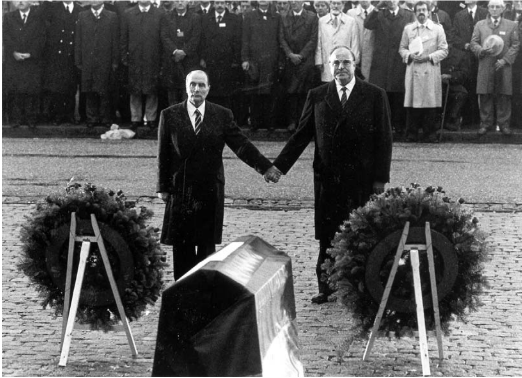
bron: Frits Boterman en Willem Melching, De Duitse Phoenix, de geschiedenis van Duitsland in de twintigste eeuw, Amsterdam 1996, pag. 312